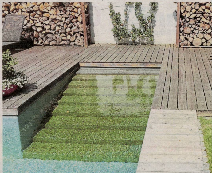
Eine Holzterrasse säumt den Naturpool.