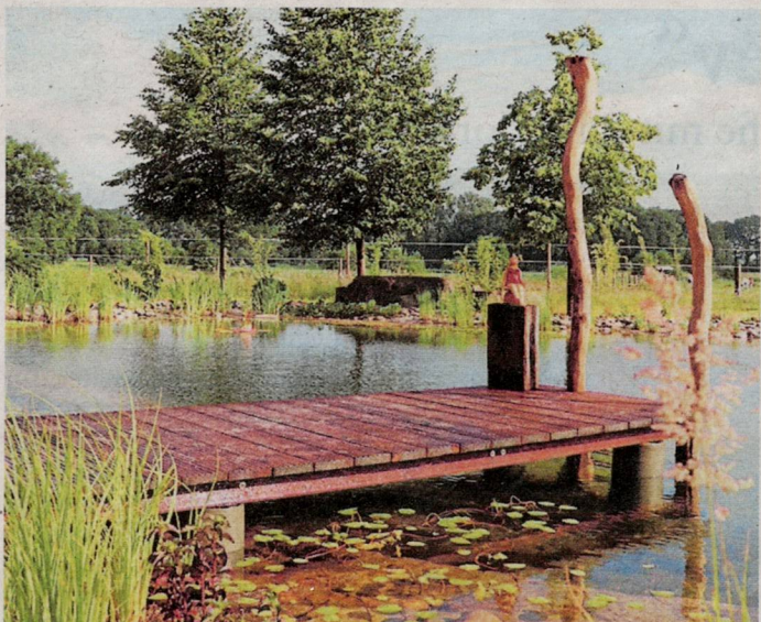
Ein Steg gehört beim Schwimmteich einfach dazu.