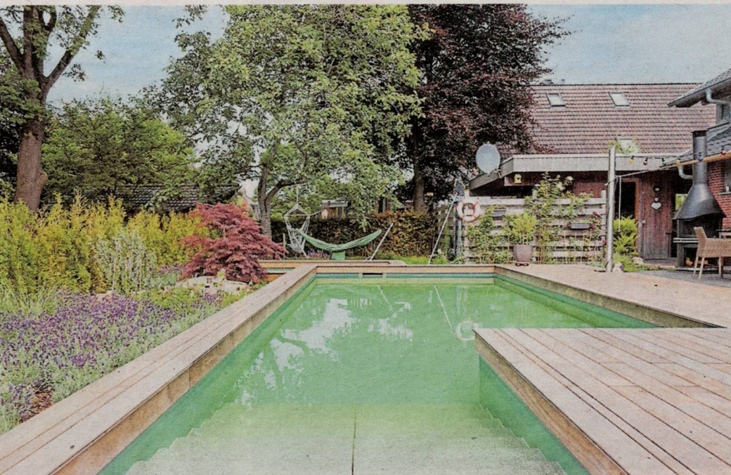
Ein Naturpool hat eine meist rechteckige Bauweise.